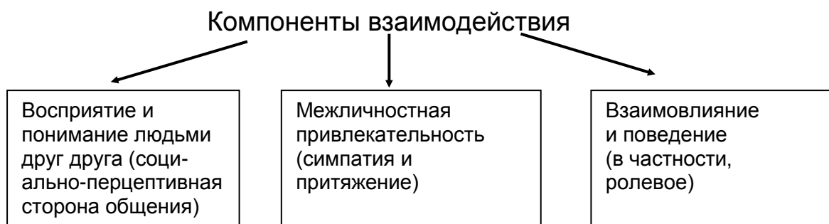
Рис. 1. Компоненты взаимодействия

Социальную перцепцию определяют как восприятие внешних признаков человека, соотнесение их с его личностными характеристиками, интерпретацию и прогнозирование на этой основе его поступков. В ней обязательно присутствует оценка другого и формирование отношения к нему в эмоциональном и поведенческом плане. На основе внешней стороны поведения мы как бы «читаем» внутренний мир человека, пытаемся понять его и выработать собственное эмоциональное отношение к воспринятому.